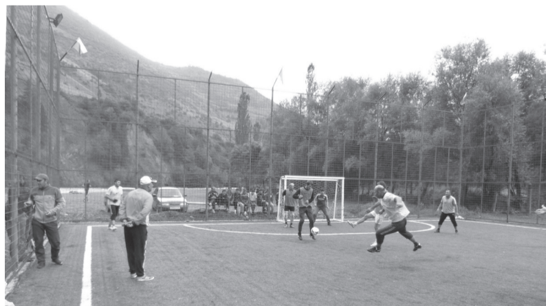
тIоцебесеб букI ккуна Цемар росдал командаялгь.

Бергьарал командабазе кьуна тIадегIанал шапакьатал,