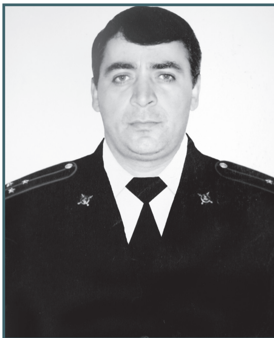
Россиялгь Рамазан дур цIар ахIилин, Гьелгьий цакав гьечIо, шулаго лъала.

Гумрудул сонал дур гIемер рукIинчIо, ГIадамаз кIалалгь мун рехсананиги.